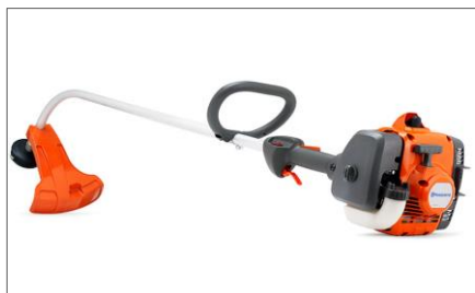
Photo du produit

Le coupe-bordure Husqvarna I29C est équipé d'un puissant moteur de 27cc et de qualité professionnel – combiné à une véritable facilité d'utilisation. Il est facile à démarrer grâce au système Smart Start®, les contrôles sont intuitifs avec entre autre un système de retour automatique du bouton stop. Pour un confort maximale, le I29C est livré avec arbre courbe.