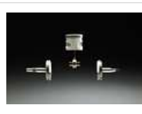
Vitebrequin trijugué Husqvarna se compose de deux moitiés forgées reliées au maneton. Cette solution offre une excellente résistance à l'usure et une longue durée de vie. Le carter est en alliage magnésium : plus léger et plus résistant.