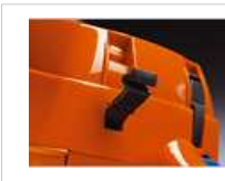
Accès facile et rapide au filtre à air et à la bougie