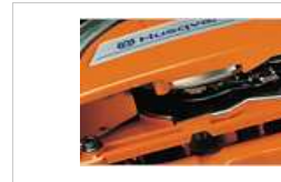
Réglage facile du débit d'huile pour un meilleur graissage de la chaîne en fonction du type d'utilisation