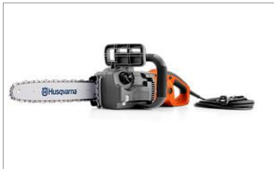
420 EL - 40SN